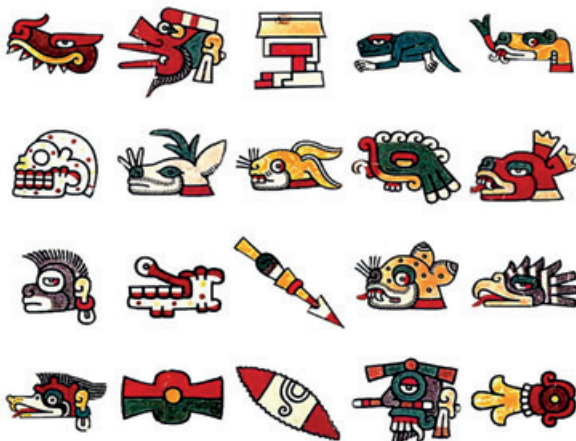
Veinte son los signos-días del Tonalámatl citados tanto en códices como en el Calendario Azteca.