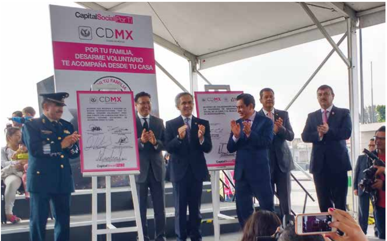
Firma de Acuerdo del Programa "Por Tu Familia, Desarme Voluntario"