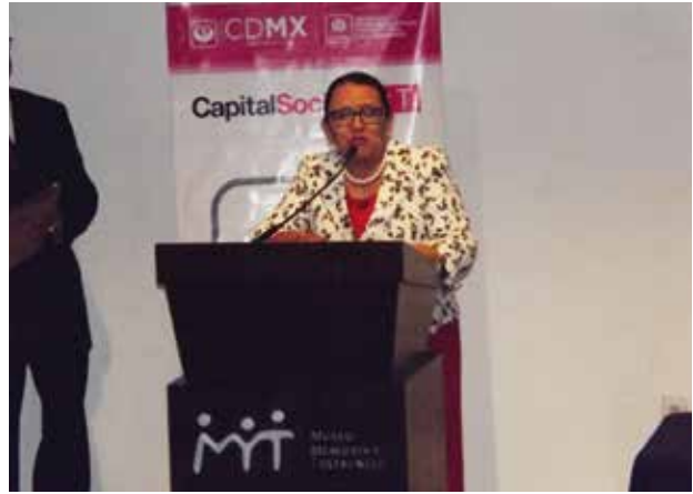
La Lic. Rosa Icela Rodríguez Velázquez, Titular de la Secretaría de Desarrollo Rural y Equidad para las Comunidades

La Secretaria Rodríguez Velázquez dio las gracias a la UTEP por el apoyo, las facilidades y