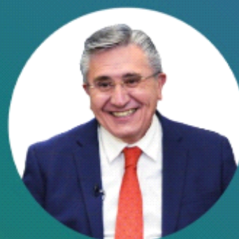
Dr. Luis Raúl González Pérez

Ministro de la Suprema Corte de Justicia de la Nación