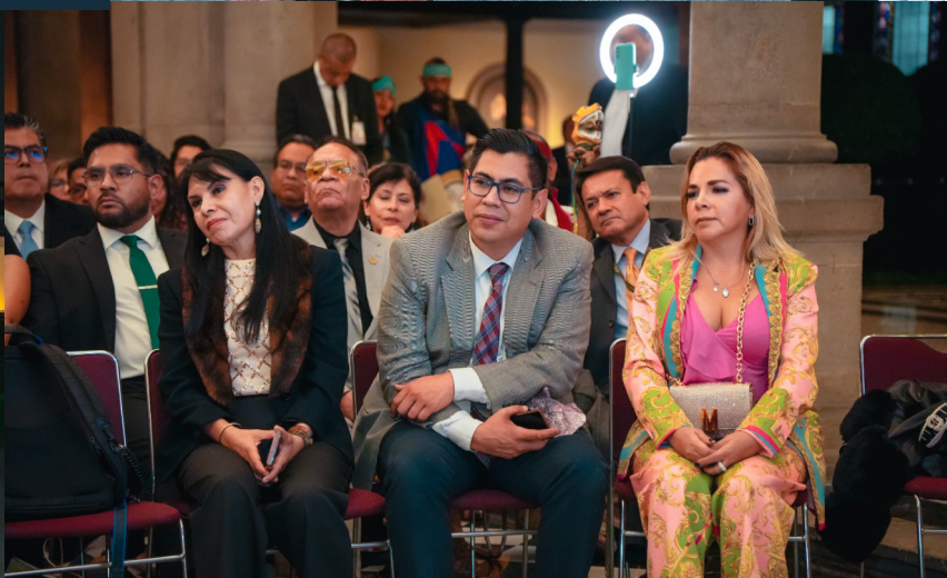
Algunos de los asistentes a dicho evento