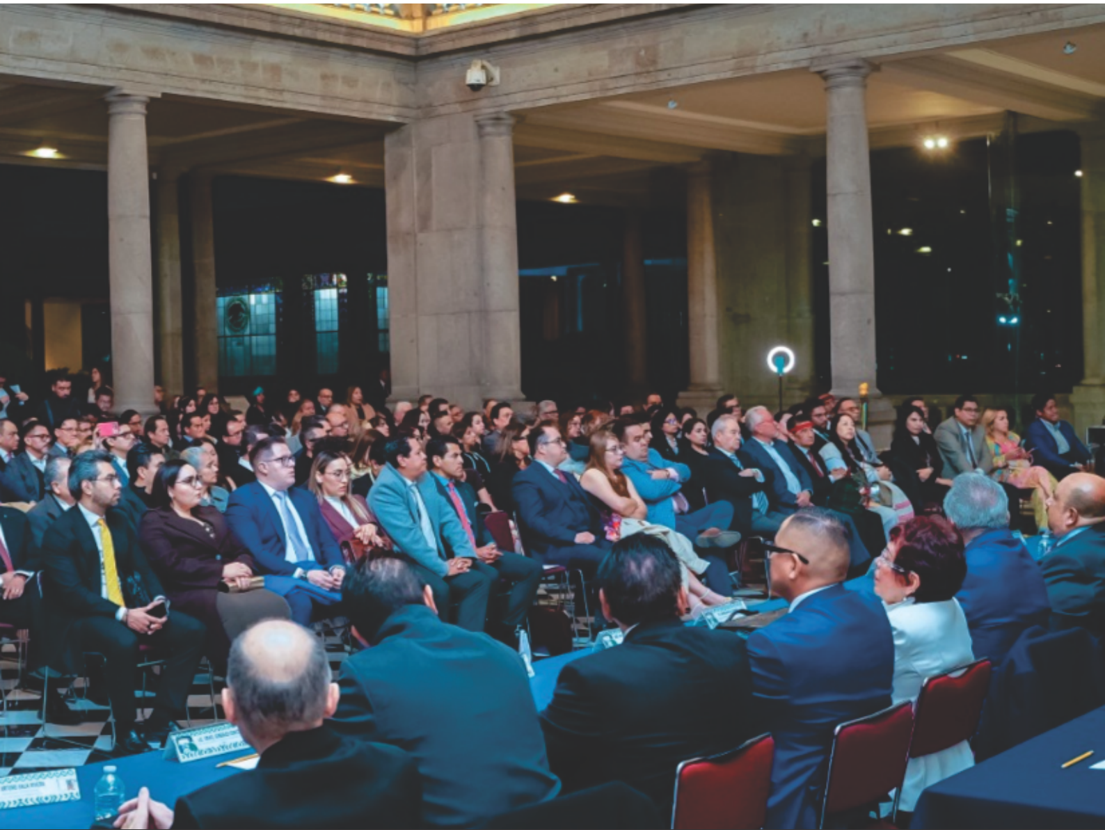
Panorámica de la XXXV Entrega de la Presea Tepantlato en el Alcázar del Castillo de Chapultepec