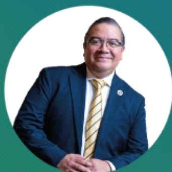
Mtro. Irving Espinosa Betanzo

Ministro de la Suprema Corte de Justicia de la Nación